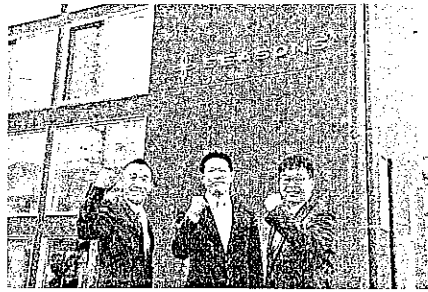
シーズンのスタッフ

お客さまとのつながり、「良い家を造る」という社員の心意気。いずれも固い絆を大切に仕事をしています。